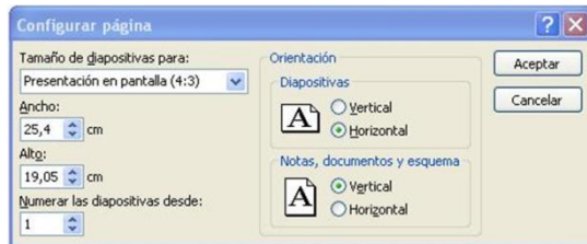
Figura 2. Cuadro de dialogo de Configurar Página

En el cuadro de diálogo que te aparece a continuación puedes modificar el tamaño, la orientación y la numeración de la diapositiva (véase figura 13). Al finalizar los cambios, haz clic en el botón Aceptar .