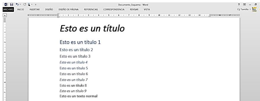
Figura 1.2. Documento Word con un título principal y varios niveles de títulos.